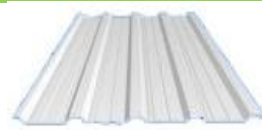
Metalsheet 0.47มม.น.สปูหนา 2.5cm.

Green+ นิวสโตร์ เกรย์แกรนิต (Grey Granite)หรือเทียบเท่า