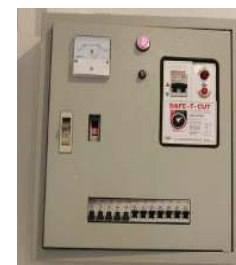
ตู้คอนโทรล1หรือ 3ฟส+ เซฟตี้คัท