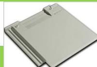
นิวสโตร์ เกรย์แกรนิต