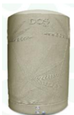
ถังเก็บน้ำ 2,000 ลิตร DOS DE-01