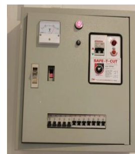
ตู้คอนโทรล1หรือ 3เฟส+ เซฟตี้คัท