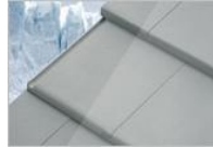
เพรสทิจ สิคลาสสิกเกรย์