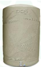
ถังเก็บน้ำ 2,000 ลิตร DOS DE-01