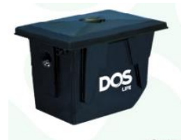
ถังดักไขมัน ฝังใต้ดิน DOS GT-02/BK-40L